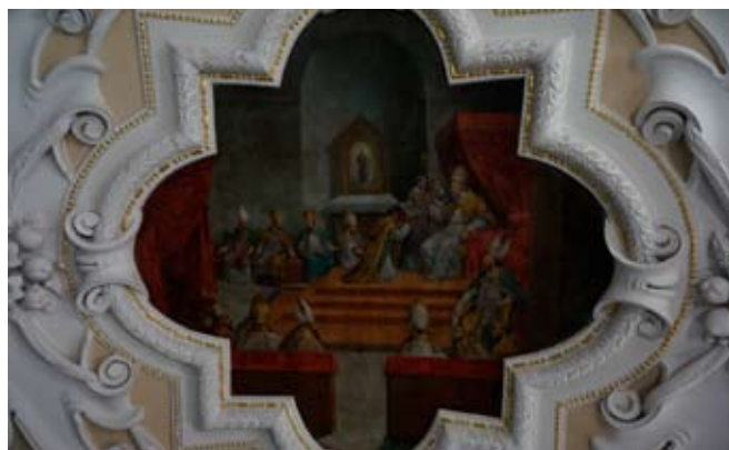
■ Výmalba kaple sv. Ignáce na Svaté Hoře u Příbrami od Josefa Bosáčka, z let 1891–1892