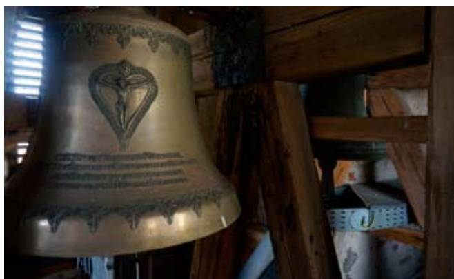
■ Nové zvony ve věži kostela

Maková jako posvátná hora přitahuje lidi i svým vzácným spojením pozemských a vyšších kosmických energií. Jde o magické místo a strávit zde noc znamená silný zážitek. Např. na stránkách Putující.cz je tomuto fenoménu věnován obsáhlejší příspěvek, popisující zážitky z ulehnutí na