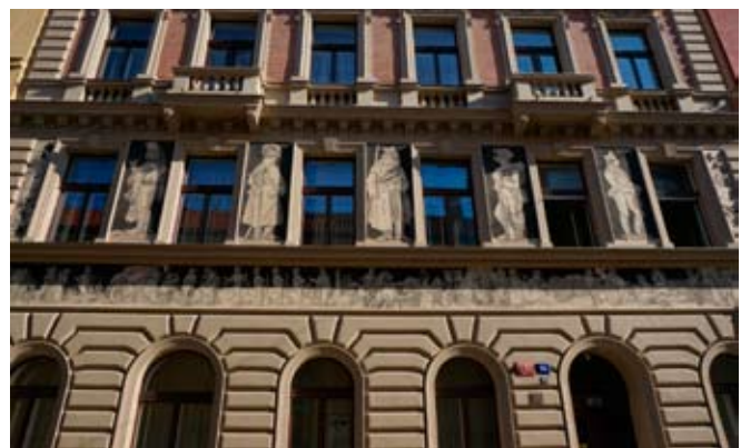
■ První sgrafito Josefa Bosáčka dle Alšových návrhů v Ostrovní ulici v Praze, z roku 1889