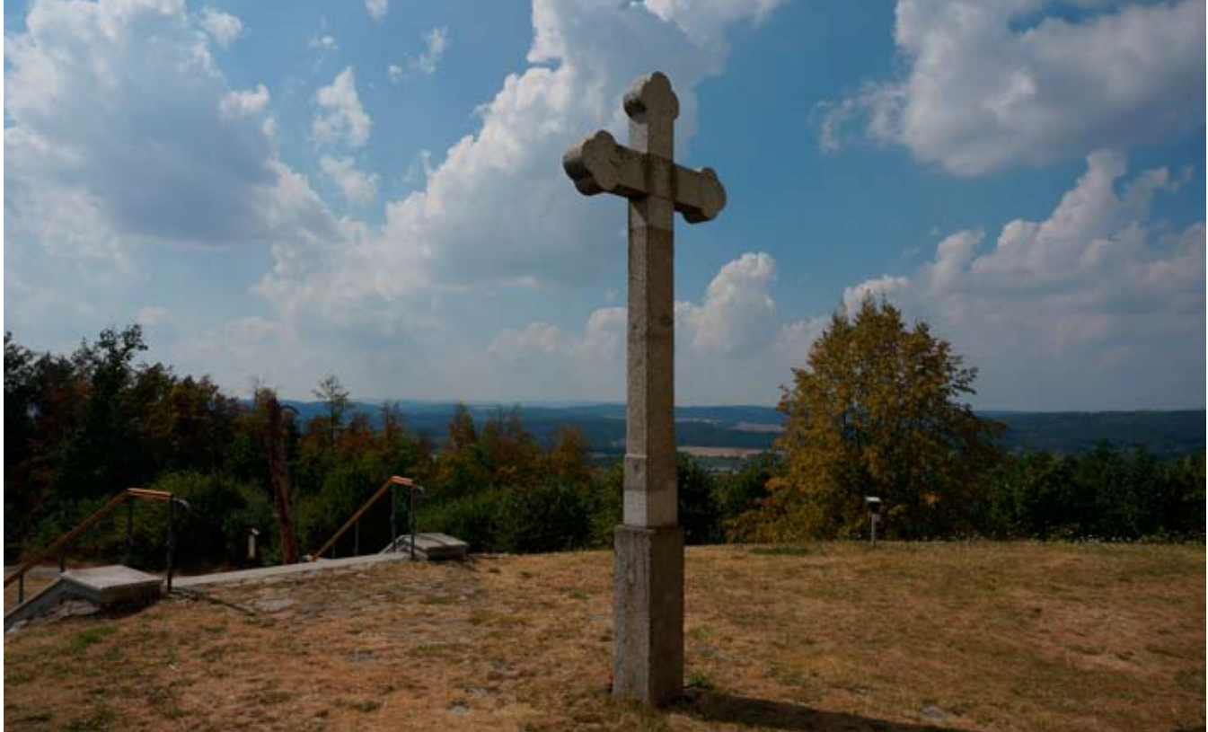
■ Výhled z Makové hory

kámen s názvem „Děblovlo lože“ s vytesaným křížem, kousek pod vrcholem hory. Na Makové jsou prý tři místa se zvláštní energií – dvě se nacházejí přímo v barokním kostele a třetí nedaleko od kostela, v podobě asi 370 let staré borovice s obrázkem Madony a Jezulátka.